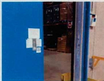
Mur de la porte coupe feu et porte Coupe Feu N°4

Concernant les autres écarts, l'exploitant a transmis les demandes d'intervention :