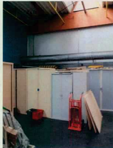
Local aménagé et Local non aménagé

L'inspection constate que la hauteur de stockage est d'environ 2,80 mètres et que le local n'est pas totalement exploité. De plus, l'inspection constate du stockage hors zone.